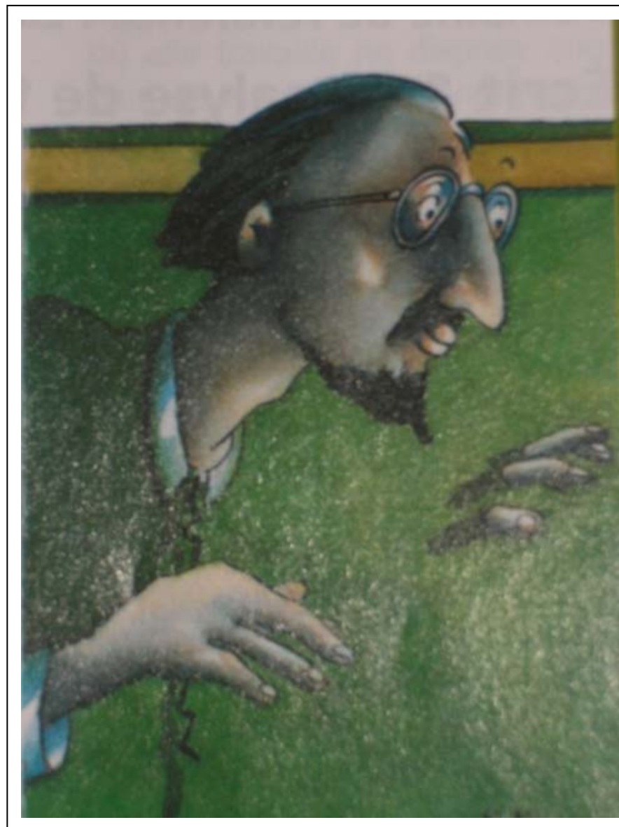
Mon « petit » copain au cimetière Jacques Duvin

Les yeux bleus regardaient le plan du cimetière dans ses petites mains. Elle marcha sur un trottoir puis elle tourna à gauche et continua d'avancer ; elle passa devant des tombes et s'arrêta. Elle sortit un bouquet de fleurs de son sac et le posa sur un tombeau de marbre. Le nom écrit sur la pierre n'était pas clair. C'était celui de sa mère. Elle rêva de revoir sa mère. Dans son rêve, elle eut des ailes à son dos et devint petite comme un insecte ; elle rencontra un autre insecte et avec lui elle fit un long voyage pour remettre les fleurs à sa mère.