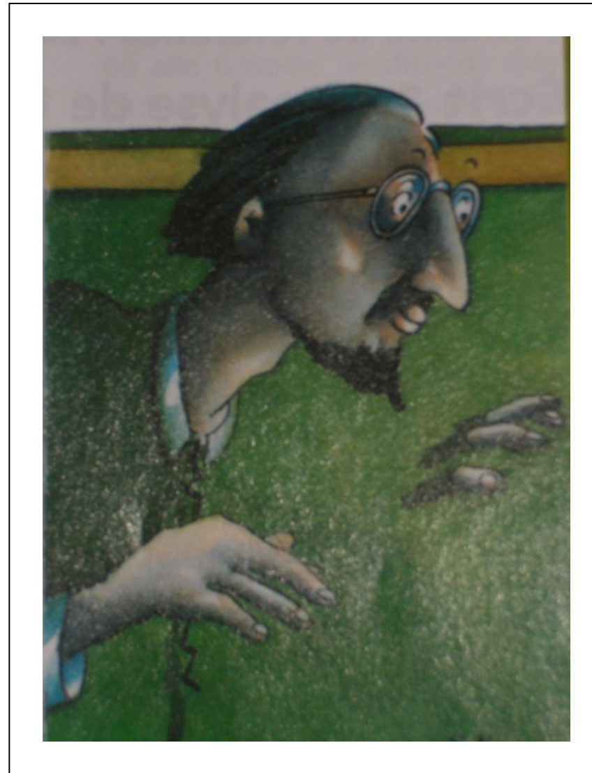
Cyrano Rodin « Un meurtre prévisible »

Elle était assise dans un fauteuil confortable de l'hôtel et pensait à son frère et son beau-père. Elle était ici pour réclamer justice car 10 ans auparavant, elle avait été accusée par ces deux hommes durs et méchants, d'avoir assassiné son mari, un homme riche, pour hériter de son argent. Elle avait fait 10 ans de prison et maintenant, elle voulait se venger.