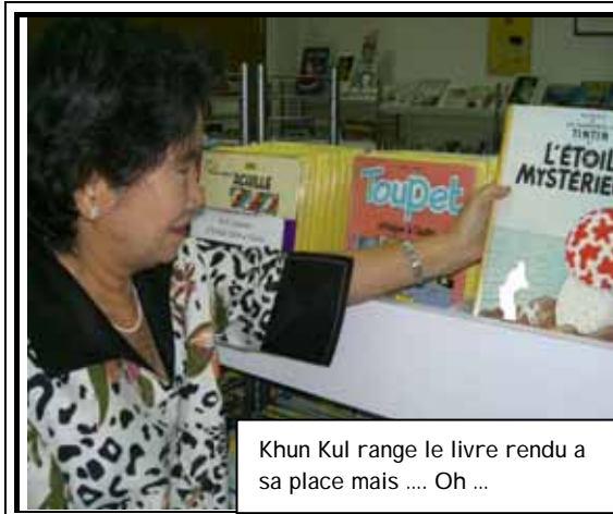
Khun Kul range le livre rendu a sa place mais .... Oh ...