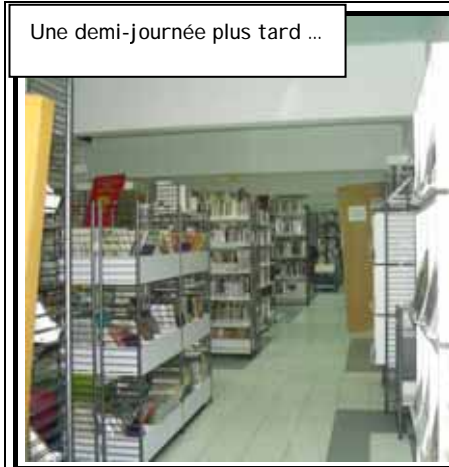
Une demi-journée plus tard ...